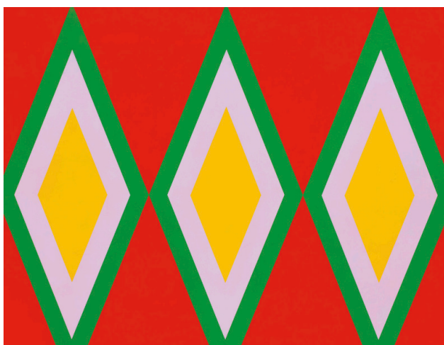
Sin título, ca. 1960-1970. Depósito indefinido de la Fundación Museo Reina Sofía, 2022